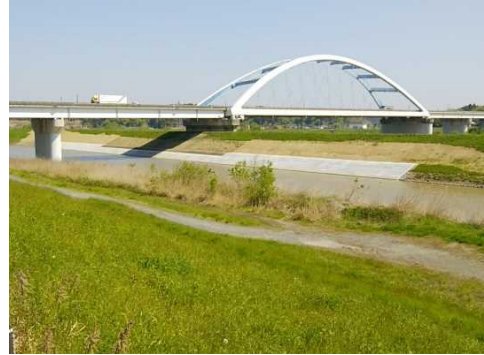
④吉田川内響地区災害復旧工事(工期:H30.9.7~R1.5.17) 新しい護岸が完成しました。