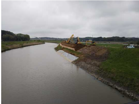
③吉田川宿浦地区災害復旧工事(工期:H30.9.6~R1.6.10) 壊れた護岸をなおしています。