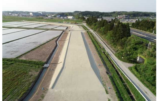
⑤吉田川上流改良築堤外工事(工期:H30.9.12~R1.5.31) 遊水地の周囲堤の盛土を行っています。