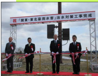
テープカット及び記念写真(ドローンによる空撮)