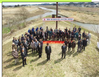
(写真左から 菅甚建設(株)代表取締役、下桧和田区長、大和町長、北上川下流河川事務所長)