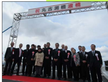
渡り初め及びテープカットの様子