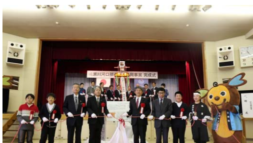
くす玉開披 記念碑除幕