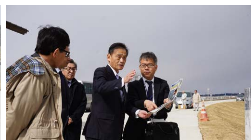
国土交通副大臣 現地視察