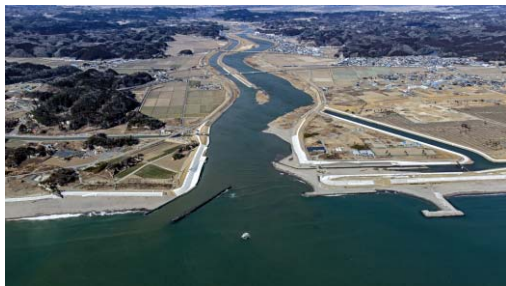
鳴瀬川河口部 現在の様子

これをうけて、2月25日（土）に東松島市小野市民センター及び野蒜水門にて完成式典を開催しました。