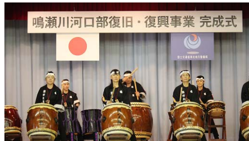
オープニングセレモニー【鳴瀬鼓心太鼓】