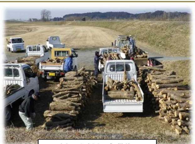
昨年の伐採木の提供状況