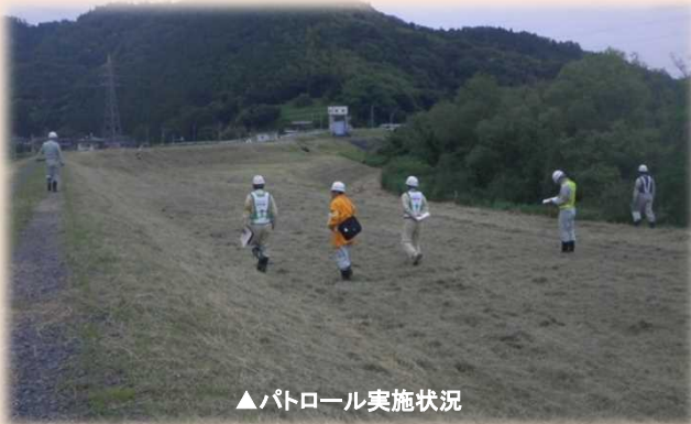
▲パトロール実施状況

安全な工事現場となるように意見交換で指摘された改善点等の対策を行いながら、引き続き、無事故で取り組んでいきます。