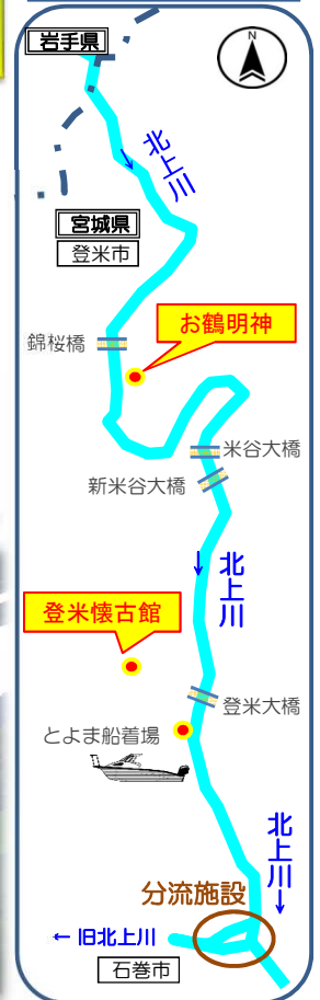
米谷出張所 管内図