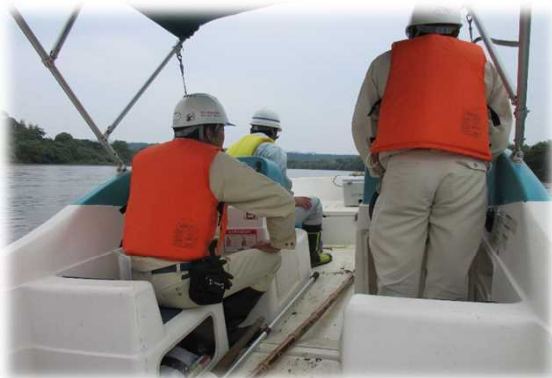
水際付近の護岸の点検の様子

米谷出張所では、6月27日(木)に河川巡視の一環として、船を利用した船上巡視を行いました。船上巡視は通常行っているパトロール車での巡視では見えにくい水際付近の護岸の変状や橋脚周辺などを船上から見ることで、陸上から見えにくい異状を早期発見するために行っています。今回の船上巡視では、特段目立った異常などは確認されませんでした。船上巡視は、洪水が心配される時期の前後に定期的に行っています。