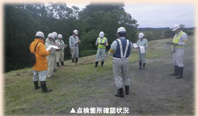
▲点検箇所確認状況