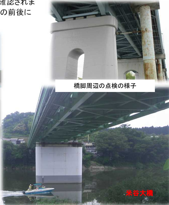
橋脚周辺の点検の様子