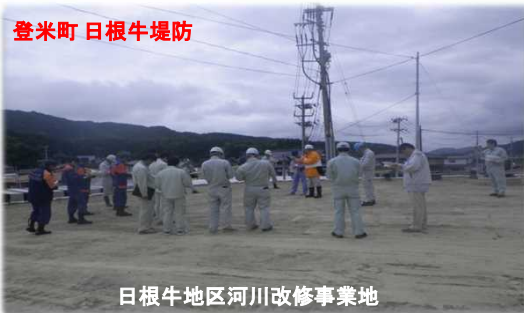
日根牛地区河川改修事業地

(※)【重要水防箇所】とは？ 洪水時に危険が予想され、重点的に巡視点検が必要な箇所を示したもの