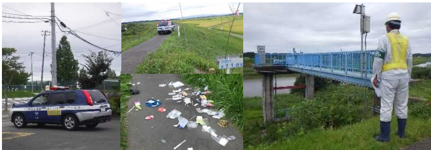
↑不法投棄されたゴミ