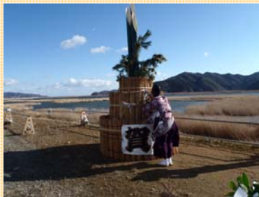
▲7年ぶりに設置された門松。神事が執り行われた。

石巻市北上町の北上川左岸、新北上大橋の下流すぐのところに「ジャンボ門松」が戻ってきました。