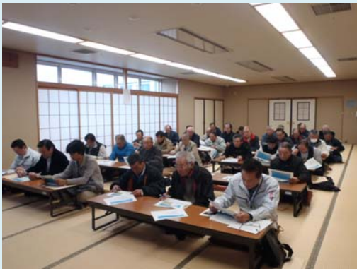
会場を移して実施した飯野川出張所分科会。出勤時の疑問点や要望事項など活発な意見交換が行われた。◀

去る12月7日(木)に石巻市河北総合センター「ビッグバン」にて水門等水位観測員講習会が行われました。