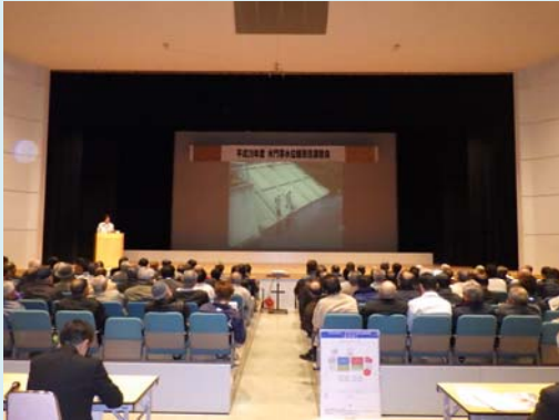
米谷出張所・涌谷出張所の観測員さんを含めた全体講習会のようす。◀