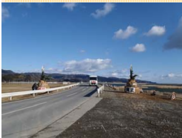
▲門松は新北上大橋の下流約200mに設置されています。