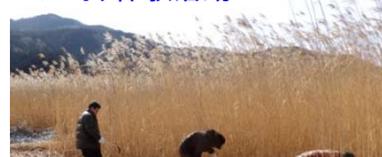
ヨシ刈り体験活動