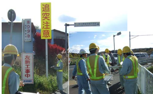
↑ 第1回の検討会では、実際に現地で通学路の問題箇所の確認を行いました。