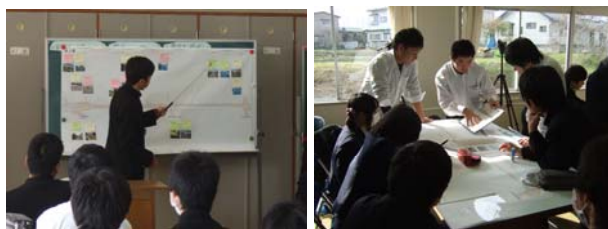
↑ 第2回の検討会では、現地点検を終えて問題点や課題の整理を行いました。

国道4号の一関市高梨交差点から一関大橋北交差点間は、通勤・通学のための歩行者、自転車の交通が非常に多い箇所ですが、歩道が無かったり幅が狭い箇所があり危険な状態となっています。こうしたことから、歩行者、自転車の通行の確保や事故の削減を図るため交通安全対策を実施するにあたり、地域の皆様からご意見をいただく懇談会を開催してきました。この中で利用者の立場から現状の問題点、対策案などを検討していただくため通学路として利用している一関工業高校土木課の生徒さんに総合学習の一環として参加していただきました。