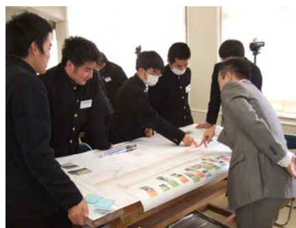
↑ 第3回の検討会では、課題箇所について対策案を検討しました。