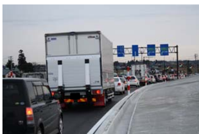
▲開通直後の交通状況(開通区間南端部)

開通式では、岩手県知事、盛岡市長らによるテープカット、くす玉開披が行われました。また、下久根さんさ踊り保存会と都南太鼓保存会の演舞のほか、地元キャラクターや多数の住民の方々も訪れ、歓迎していただきました。