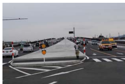
▲開通直後の交通状況(開通区間北端部)