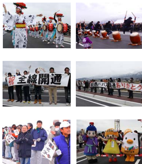
▲お祝いにいらっやった市民の方々