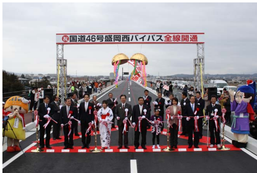
▲テープカット、くす玉開披