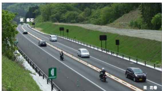
▲開通6ヶ月後の東北横断自動車道釜石秋田線

◆開通以降利用交通量は増加し続けています。5月5日は過去最高 11,980台/日