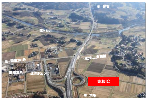
▲宮守IC～東和IC開通後の東和IC