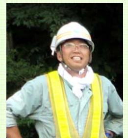
盛岡国道維持出張所長