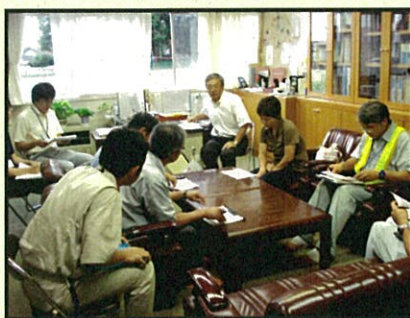
安全のための対策を検討