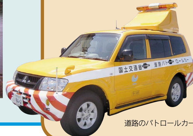
道路のパトロールカー