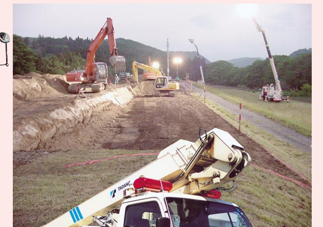
照明車 夜間の災害現場を照明で照らし、復旧活動を支援する車です。