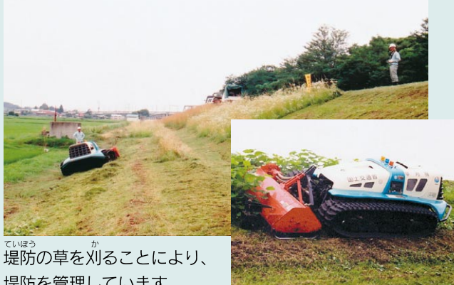
堤防の草を刈ることにより、堤防を管理しています。