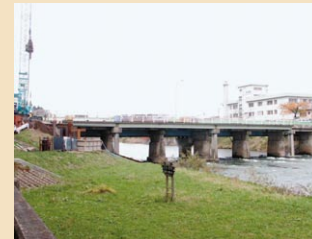
古い橋の架け替えをします。