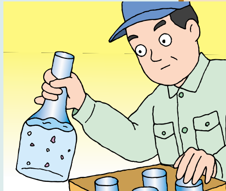
水が汚れていないか进行检查しています。