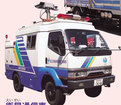
衛星通信車 通信衛星回線を利用して、現場の映像を災害対策室に送信する車です。