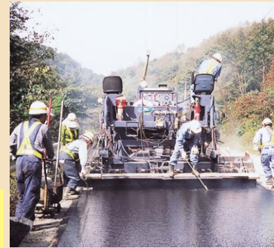
道路の壊れた所を補修します。