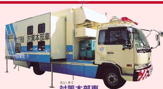
対策本部車 災害発生時に現地の対策本部として、指揮・情報収集・連絡・広報を行う車です。