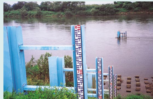
川の水位を観測しています。