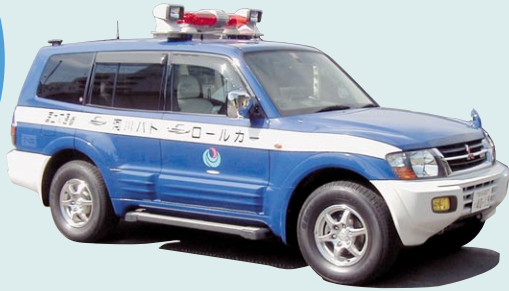
河川のパトロールカー