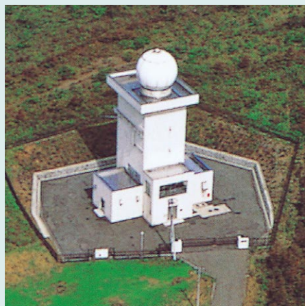
洪水の予報のため、レーダー雨量計が活躍しています。