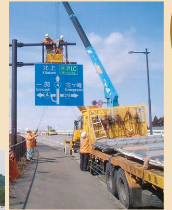
道路標識の補修や区画線の修繕、道路の壊れた所の補修をします。