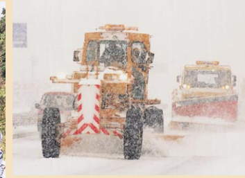
冬は車が通れるよう除雪します。