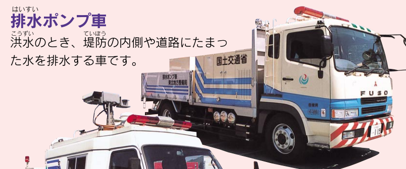
排水ポンプ車 洪水のとき、堤防の内側や道路にたまった水を排水する車です。