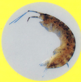
ニホンドロソコエビ