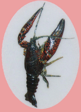
アメリカザリガニ