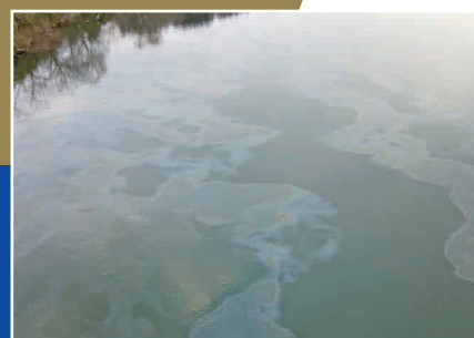
油の回収作業の様子