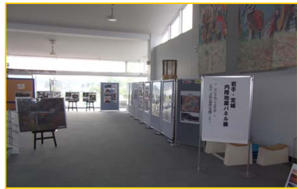
岩手・宮城内陸地震パネル展入り口の様子です。

地震の概要から震災の初期対応、被災状況、復旧の写真及び説明パネルを展示しています。