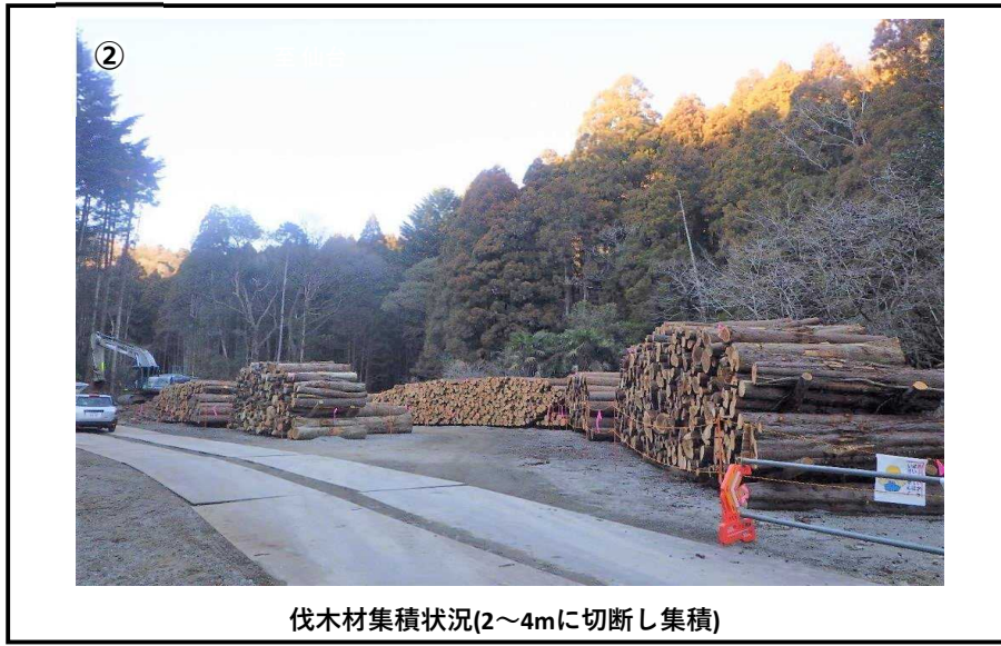
伐木材集積状況(2~4mに切断し集積)