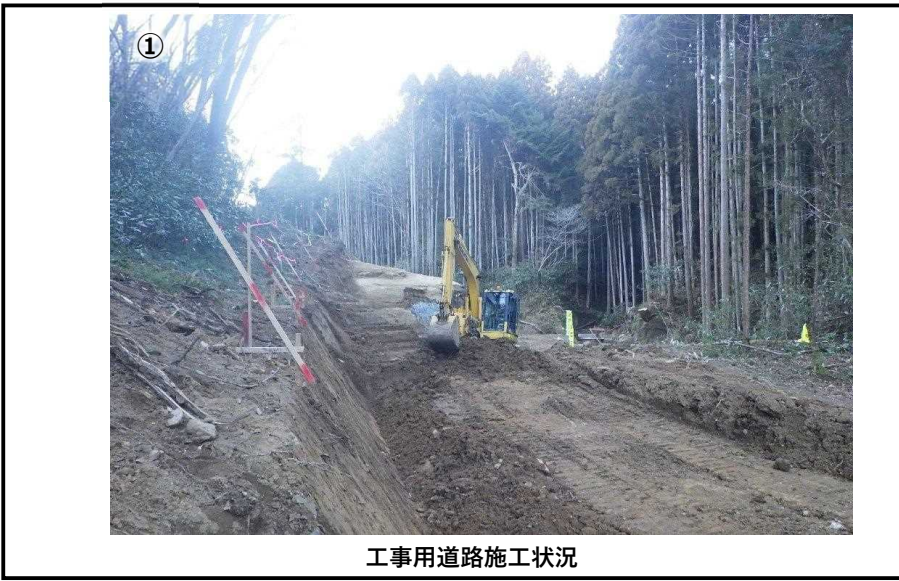
工事用道路施工状況