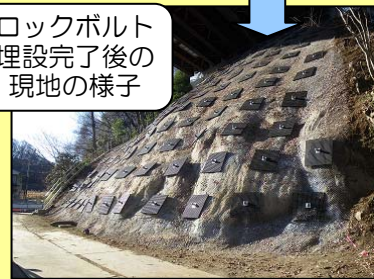
ロックボルト埋設完了後の現地の様子

（発行元） 国土交通省 東北地方整備局 磐城国道事務所 平出張所 〒970-8021 いわき市平中神谷字六本樓20 Tel. 0246-34-8394