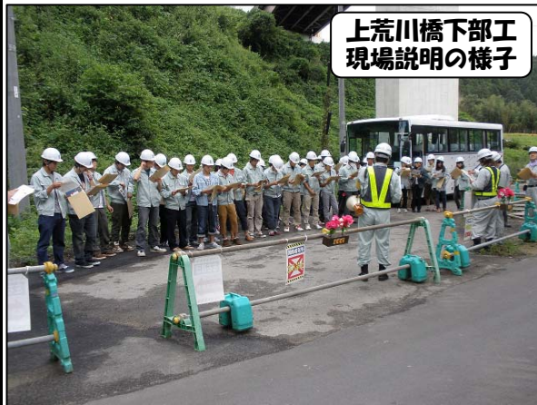
上荒川橋下部工 現場説明の様子