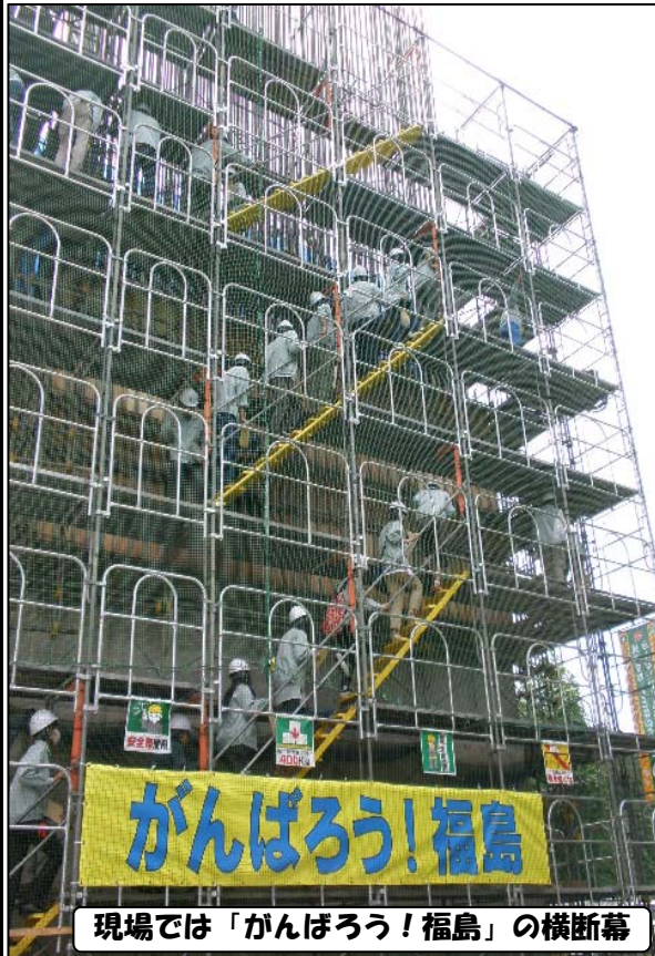
現場では「がんばろう! 福島」の横断幕

9月7日、福島高専・建設環境科の4年生と5年生の生徒合わせて85名が、御厩地区道路改良工事（上荒川橋下部工）と、御厩地区道路路面工事（五郎内地区法面工）の工事現場にて現場見学会を行いました。