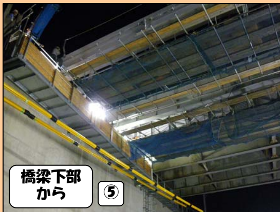
⑤ 橋梁下部 から