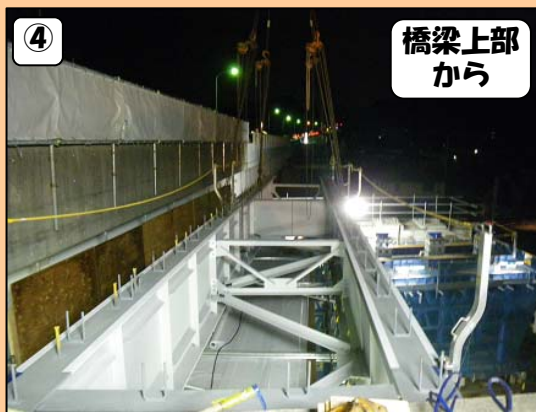
④ 橋梁上部 から