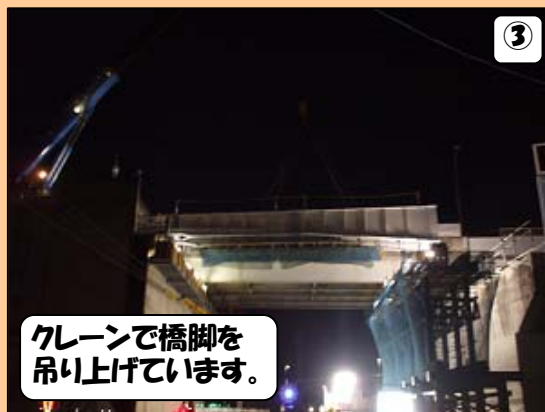
③ クレーンで橋脚を 吊り上げています。