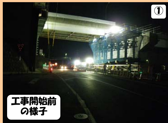
① 工事開始前 の様子