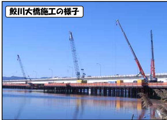
鮫川大橋施工の様子

11月12日に、常磐・平バイパス安全協議会と平出張所合同で、鮫川大橋下の清掃活動を行いました。鮫川大橋の下にはたくさんのゴミがあり、それらを手作業で分別・除去して、袋詰めにしました。当日は約30人で1日かかりでゴミ袋600袋分の分別・除去ができました。