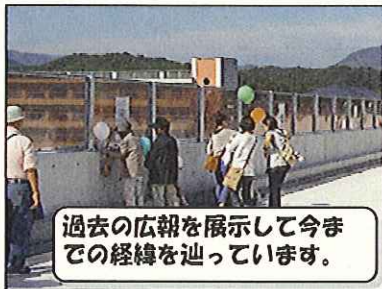
過去の広報を展示して今までの経緯を辿っています。

10月16日、間もなく施工が完了する御厩橋梁上部工工事の現場見学会を行いました。当日は天気にも恵まれ、地域の方々約60名の方々にお集まりいただきました。今回はその時の模様を記事にしました。