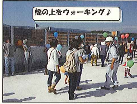
橋の上をウォーキング♪

10月16日、間もなく施工が完了する御厩橋梁上部工工事の現場見学会を行いました。当日は天気にも恵まれ、地域の方々約60名の方々にお集まりいただきました。今回はその時の模様を記事にしました。