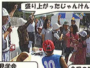
盛り上がったじゃんけん大会