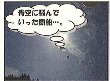
青空に飛んでいった風船…。