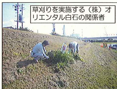
草刈りを実施する(株)オリエンタル白石の関係者

10月3日(日) 鮫川河川敷公園にて地域の方々約500名が参加して草刈り・清掃活動が行われました。付近で鮫川大橋下部工工事を施工している(株)オリエンタル白石の関係者と平出張所の職員も清掃作業に参加しました。