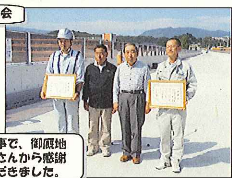
今回の工事で、御厩地区の区長さんから感謝状をいただきました。