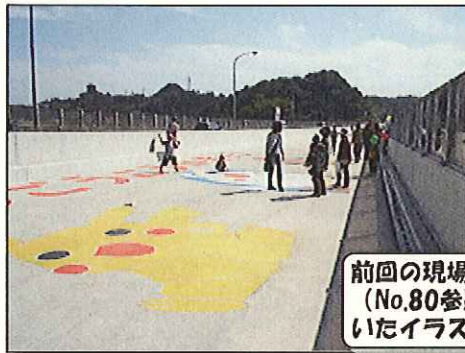
前回の現場見学会(No.80参照)で橋に描いたイラストです。