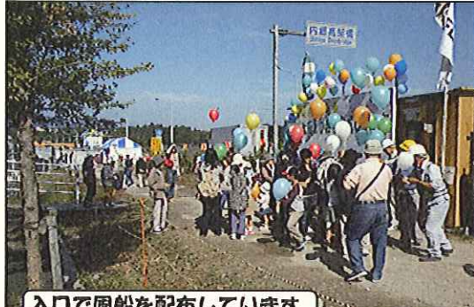
入口で風船を配布しています