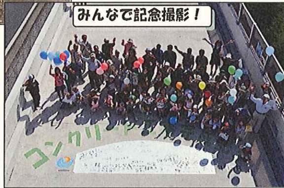
みんなで記念撮影!