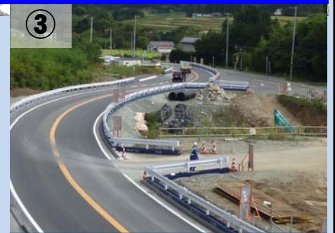
③地点から相馬市街方向を望む