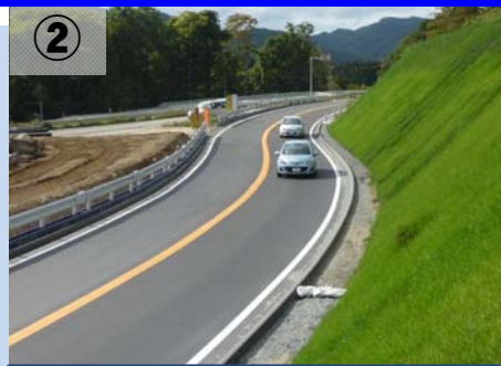
②地点から福島方向を望む