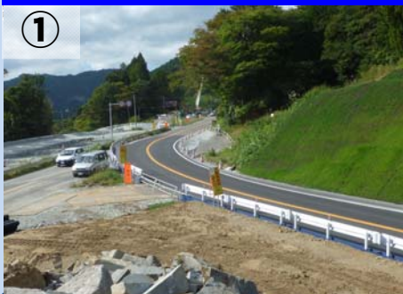
①地点から福島方向を望む