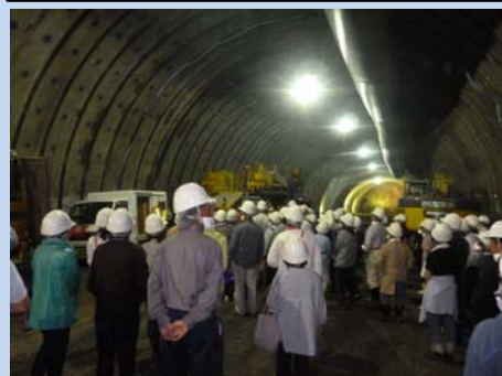
▲トンネル施工機械の説明