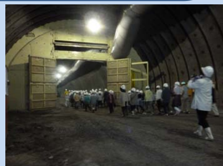
▲防音扉を通りさらに奥へ