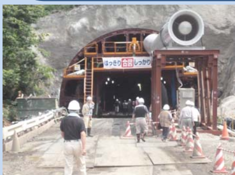
▲受付を済ませてトンネルの中へ

阿武隈東道路としては最後のトンネル工事である「(仮称)玉野トンネル」の工事現場において、地域の方々を対象とした現場見学会(受注者主催)が開催されました。見学会では、トンネルの掘削状況や工事で使用する建設機械の見学、発破の体験などを行うことにより、工事の進捗を感じて頂くとともに、事業及び建設業への理解と興味を深めていただけたことと思います。参加された皆様お疲れ様でした。