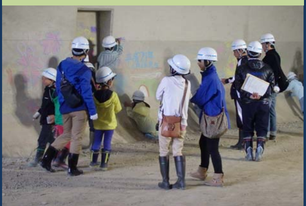
トンネル壁面にメモリアルアート(檜這トンネル)