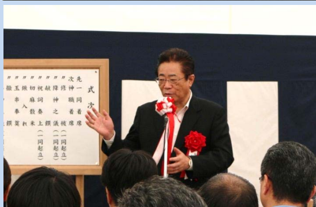
▲来賓挨拶(相馬市長)