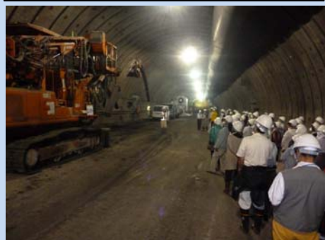
▲トンネル施工機械の説明