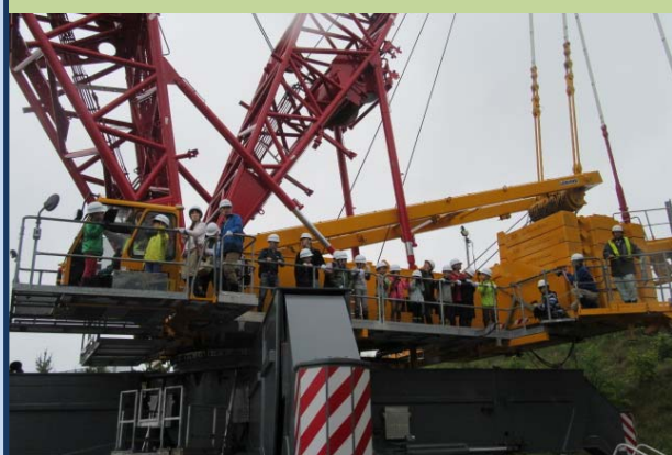
クレーン運転席への試乗(今田高架橋上部工工事)