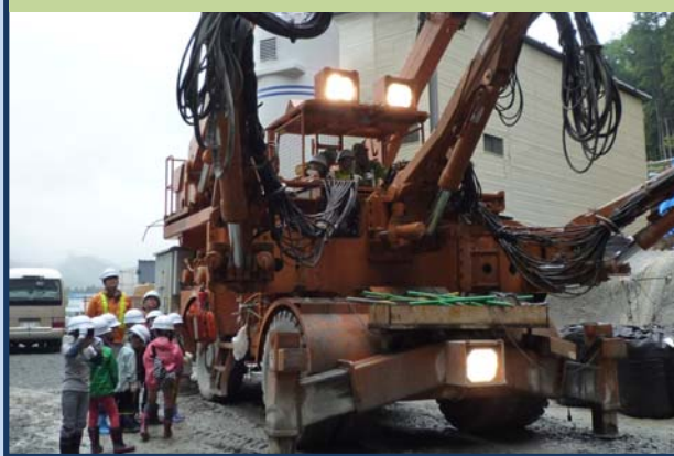
トンネル施工機械への試乗(円渕トンネル工事)