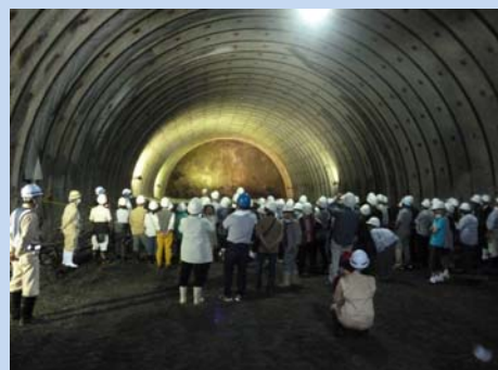
▲掘削の先端部の見学と説明