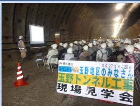
▲プロジェクターで概要説明