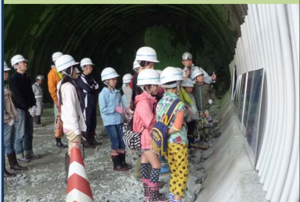
マンガパネルでトンネルの造り方説明(円渕トンネル工事)