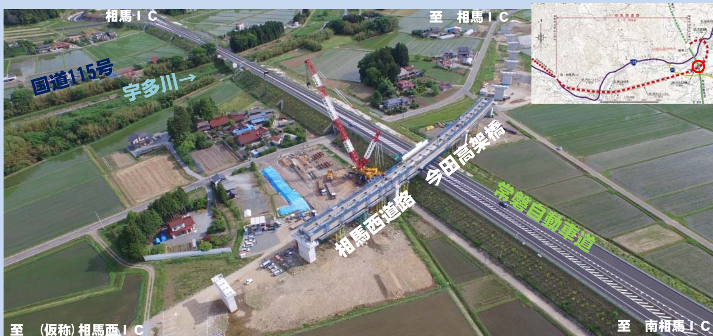
▲橋桁架設完了後(翌朝)の全景