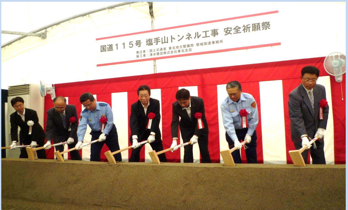
▲来賓及び関係者による安全祈願の鍬入れ