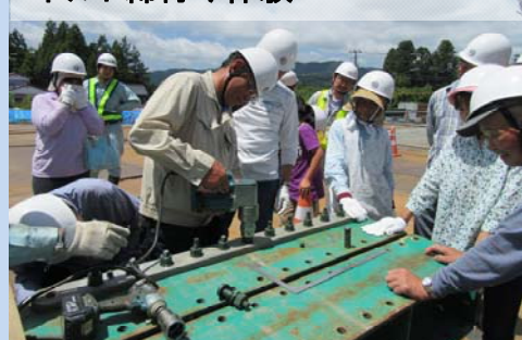
ボルト締め付け体験