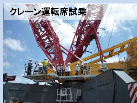
クレーン運転席試乗