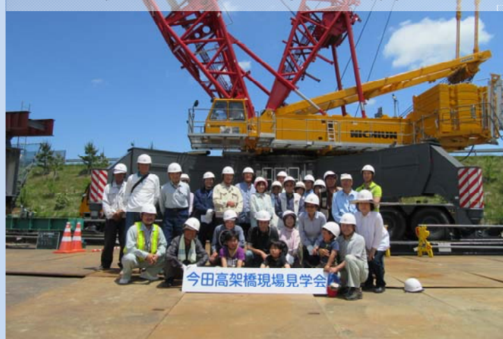
最大級クレーンを背景に記念撮影