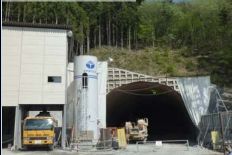
円淵トンネル(西側)

相馬福島道路（相馬西道路）の平成27年度稼働工事と4月末現在の状況についてお知らせします。