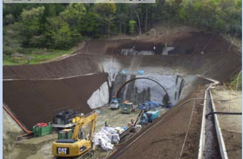
塩手山トンネル(西側)