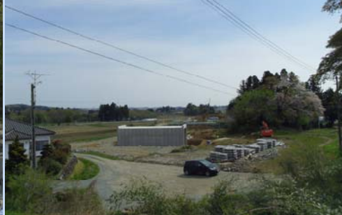
引沼地区 市道ボックス