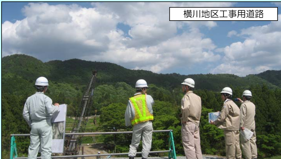
横川地区工事用道路