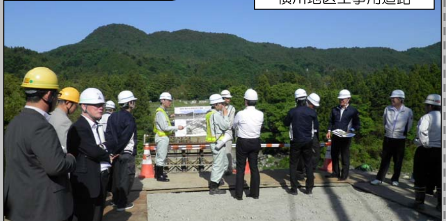
横川地区工事用道路

相馬出張所では、国道115号 阿武隈東道路・相馬西道路建設事業を多くの人に知っていただくため、工事現場の現場見学会を行っています。5月に入り、たくさんの方々が現場見学会へ訪れました。