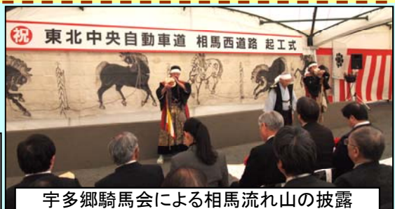
宇多郷騎馬会による相馬流れ山の披露

相馬中村藩の軍歌として歌い継がれ、相馬野馬追には欠くことのない相馬地方を代表する民謡