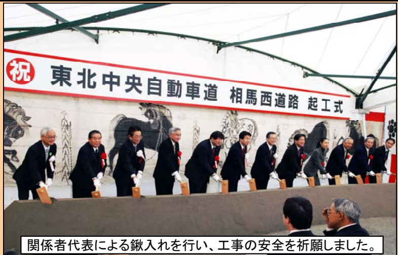
関係者代表による鍬入れを行い、工事の安全を祈願しました。

起工式には、行政・地元関係者約60人が参加し、被災地の1日も早い復興と工事の安全、早期完成を祈念して、関係者代表12名による鍬入れを行いました。