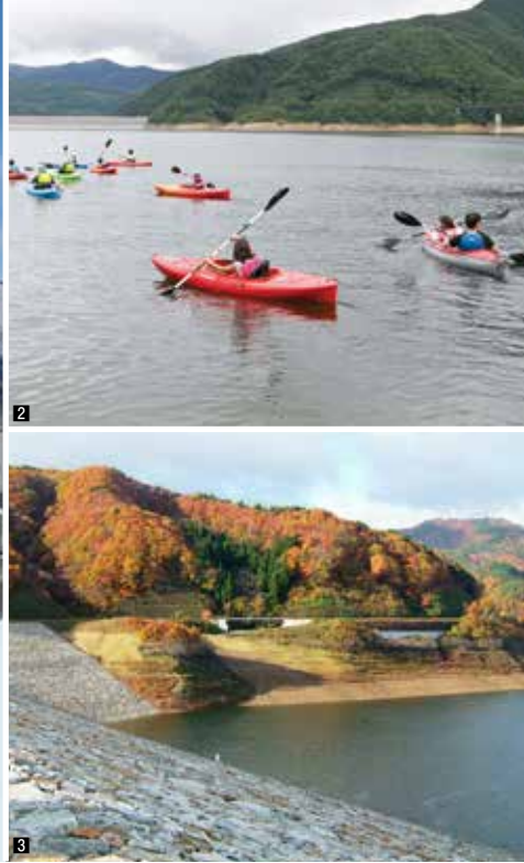
1 摺上川ダム全景 2 カヤック体験 3 摺上川ダムと紅葉