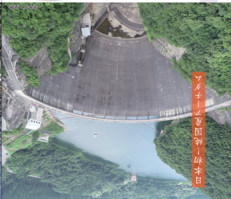
日本初「チーミナミ」の誕生を記念して「世界初」