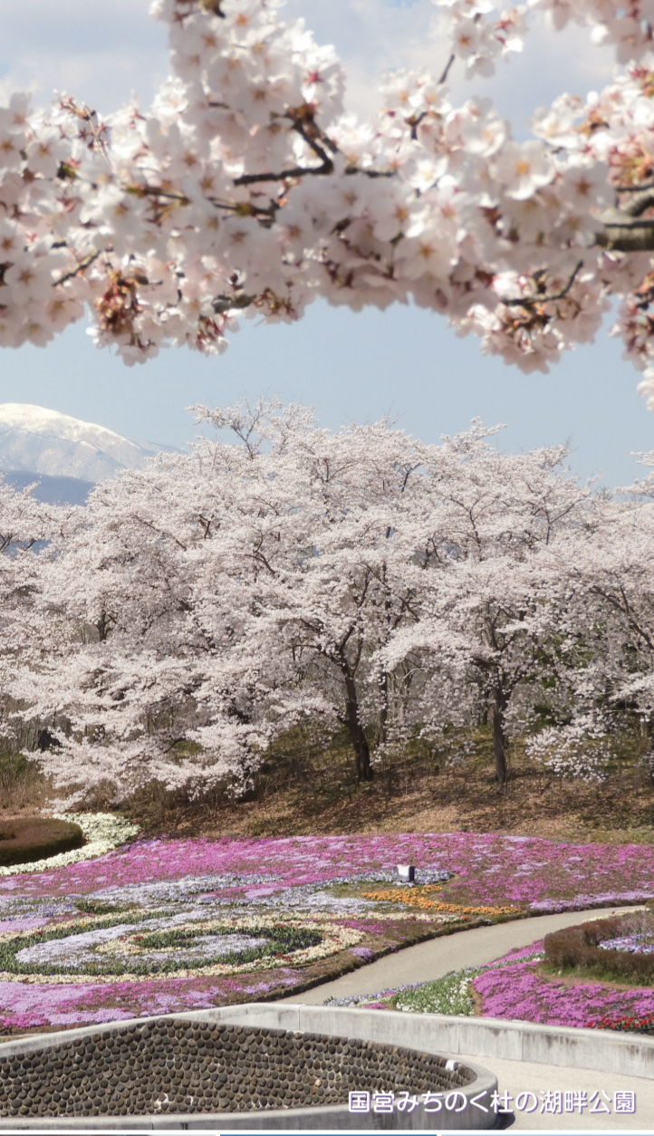
園宮みちのく社の湖畔公園