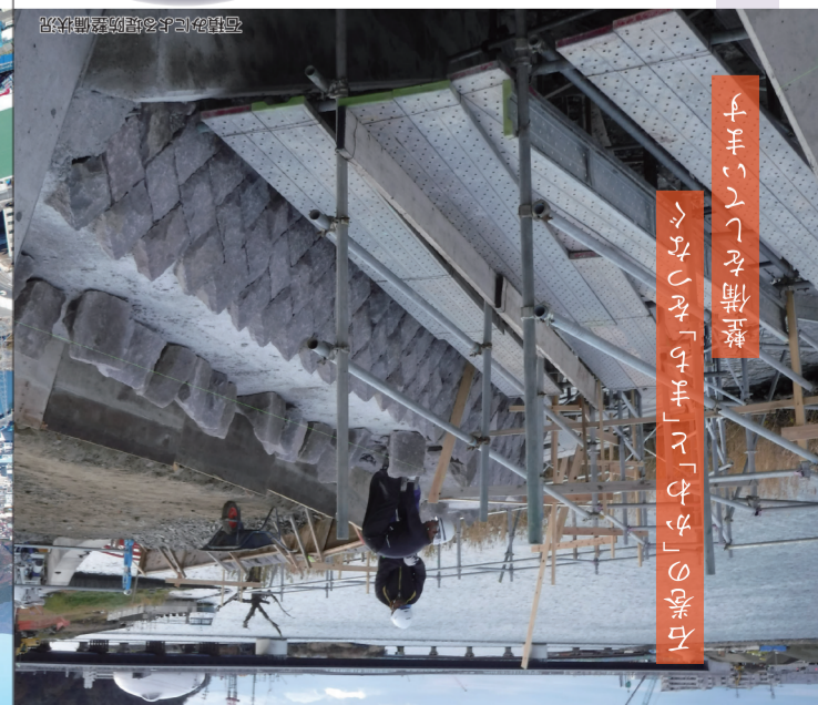
「チーミナミ」の誕生を記念して「世界初」