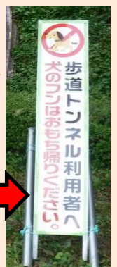
信夫山歩道トンネル(上り・終点側)