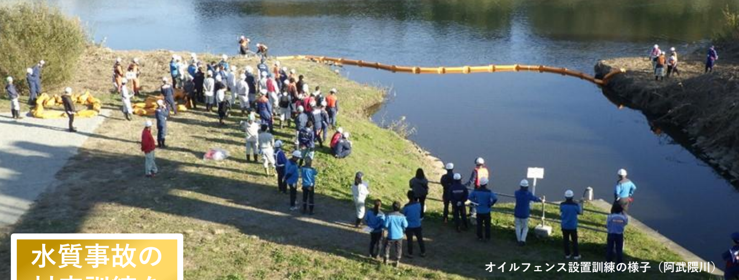
オイルフェンス設置訓練の様子（阿武隈川）

郡山出張所は、阿武隈川と支川（杉田川・笹原川・釈迦堂川）の一部を管理しています。