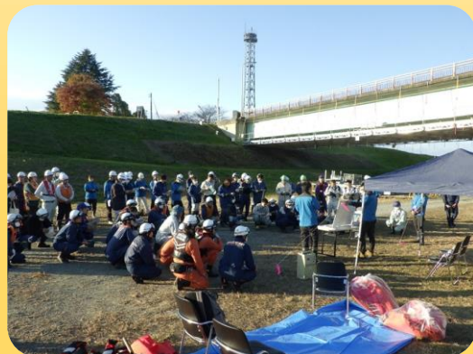
◀水質異常時に現地で行う初期対応訓練 （パケットによる簡易測定講習）