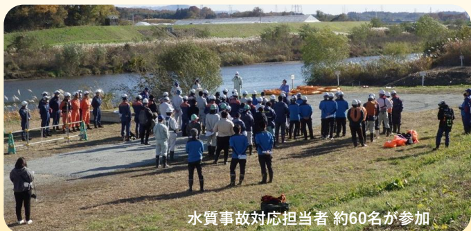
水質事故対応担当者 約60名が参加

油類等が流出した際の“迅速かつ的確な対応による被害の拡大防止”を目的に、消防署・自治体等の方々とともに訓練を実施しました。（2025.11.17）