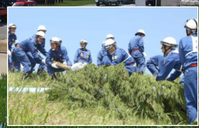
郡山市消防団：木流し工