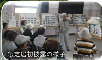
紙芝居初披露の様子