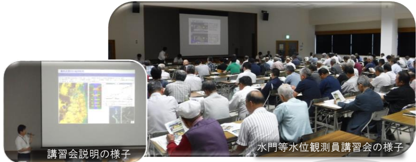
講習会説明の様子

郡山出張所管内の水門等水位観測員の皆さまにお集まりいただき、講習会を郡山市労働福祉会館で行いました。講習会では規律や樋門の点検・操作、出水時に使用する報告システムの操作確認などの説明が行われました。