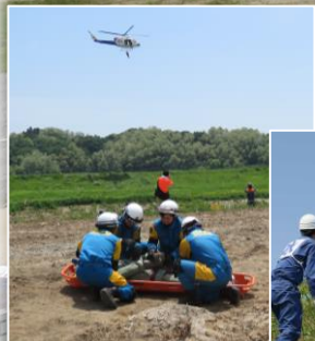
福島県警察本部 救助・救出訓練