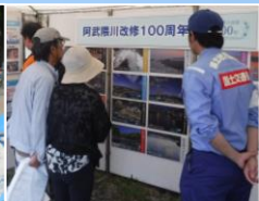
演習会場：阿武隈川 パネル展示