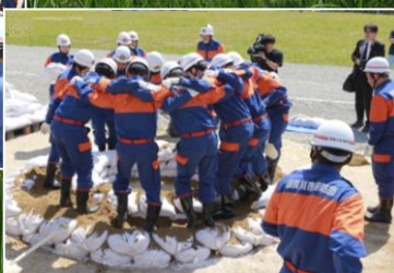
須賀川消防団：釜段工