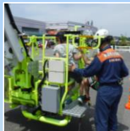
サテライト会場 日和田フェスタ 災害対策車両・機械展示