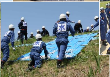
玉川村消防団：シート張工