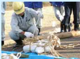
なかなかできないぞぉ~(><:)

1日目は実技で、「月の輪工」「積土のう工」「防水シート張り工」「木流し工」などの水防工法演習が行われました。2日目は、郡山市内で講習会が行われました。