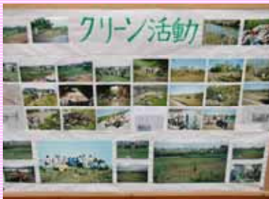
パネル展示の状況

11月12日に郡山市安積町日出山の阿武隈川河川敷で、日出山アメンボークラブさん主催による河川清掃及び河川環境美化活動が行われました。子供たちによって、花壇に菜の花の種まきも行われました。