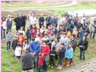
こんなにたくさんの方が参加しました!