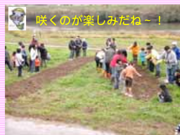
菜の花の種をまいている様子です(***)