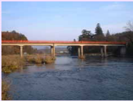
乙字橋の下を流れる阿武隈川(須賀川)