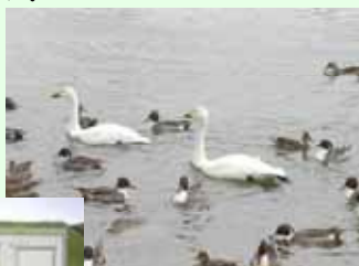
11月より白鳥のエサ小屋開設