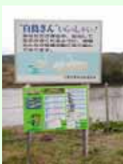
看板も立ちました！

郡山市富久山町にある白鳥飛来地の阿武隈川に10月22日、今年初めてのハクチョウが飛来しました。昨年より11日飛来が遅いとのこと。現在約130羽飛来しているそうです。