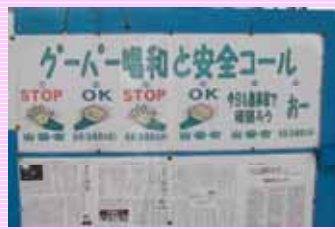
グーパー運動で安全な作業を心がけます！