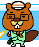
まつぼおオリジナル キャラクター さぼおじさん

下の②の工事は堰堤を造る前に山を切り開いて道路を造る工事だよ。何年もかかるすごい大変な工事だね。