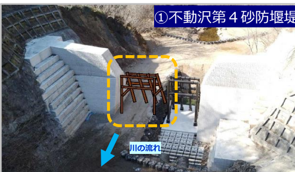
①大きな岩などを止めるための鋼製の枠を組み立てて不動沢第4砂防堰堤が完成する予定です。