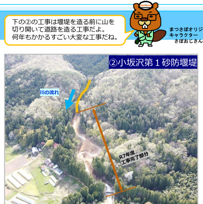
②小坂沢第1砂防堰堤を造るために必要な工事用道路を造成します。今年度の工事で堰堤施工箇所まで到達する予定です。

下の②の工事は堰堤を造る前に山を切り開いて道路を造る工事だよ。何年もかかるすごい大変な工事だね。