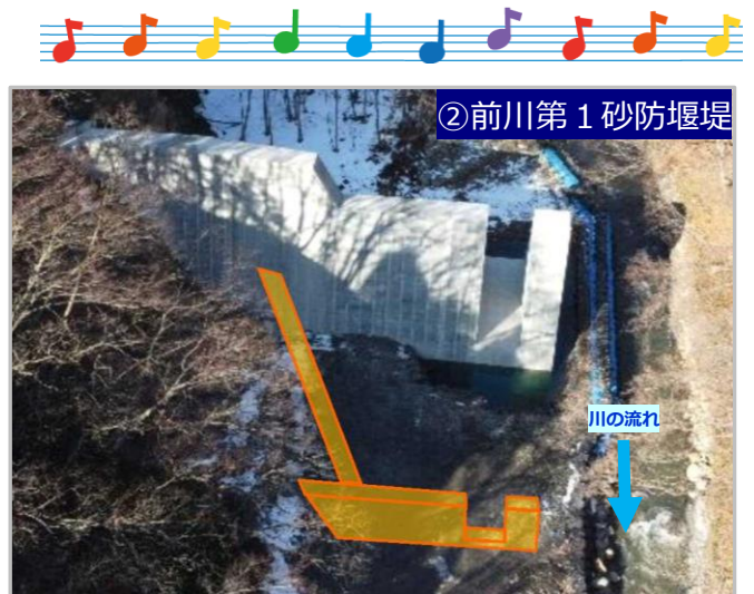
②前川第1砂防堰堤の右岸下流側(黄色部分)の施工を進めます。