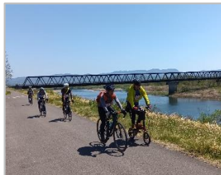
▲昭和大橋での風景

4月25日(土)、第10回阿武隈川春のサイクリングが福島市の御倉邸付近の河川敷を発着点に開催されました。今年度は80名が参加しました。福島河川国道事務所では「流域治水パネル展」を実施しました。参加した皆さんは春風を感じながら阿武隈川沿いを自転車で駆け抜けました。