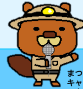
まつぼおオリジナル キャラクター さぼちゃん

令和8年度は 5月時点で2件の 工事が始まります。 これからさらに工事 が増える予定です。