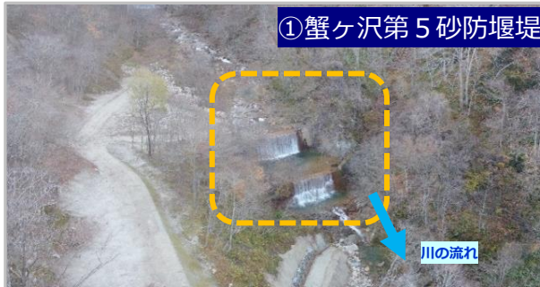
①蟹ヶ沢第5砂防堰堤の補修を行います。