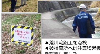
▲荒川流路工を点検 ▲破損箇所へは注意喚起板を設置しました