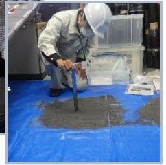
火山灰の深さを測定しています▶