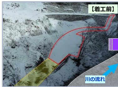
塩の川第8砂防堰堤