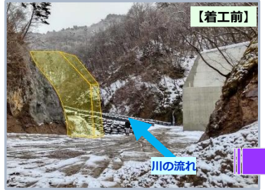
不動沢第4砂防堰堤