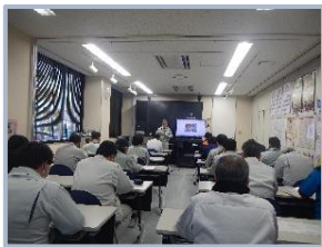
▲まとめたことを発表します