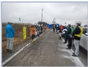
▲12社・26名でパトロールを行いました

工事関係者が現場をパトロールし、適切な安全対策をしているか等のチェックを行いました。その後、吾妻山山系砂防出張所内で討議し、発表を行いました。当日は小雨が降る中でパトロールが行われましたが、参加者は真剣にパトロールを行っていました。