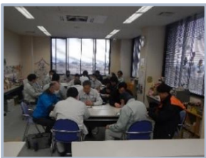
▲各班ごとに話し合い