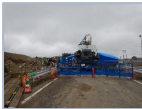
▲危険な箇所はないかチェックしました