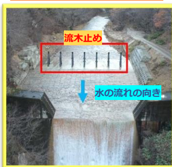
正面から見た荒川第9砂防堰堤

▲流木止めを設けることで、一時的に流木を貯留することにより土砂が一気に流れ下ることを防ぎます。