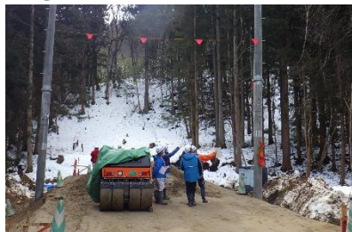
◀目印を付けた電線をチェック中