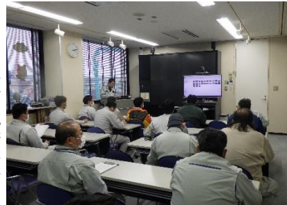
◀まとめたことを発表します