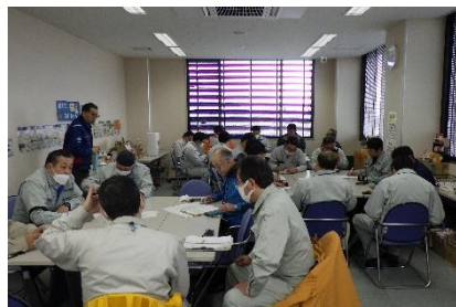
◀各班ごとに話し合い

2月17日(月)に福島河川国道事務所事故防止対策委員会第2回福島・伊達地区安全パトロールが、阿武隈川水系不動沢砂防堰堤外工事を対象に行われました。富久泉工業(株)の現場事務所や小坂沢第1砂防堰堤の現場をパトロールし、適切な安全対策をしているか等のチェックを行い、吾妻山山系砂防出張所内で討議会後、発表を行いました。当日はパトロール中に雨に見舞われましたが、参加者は真剣にパトロールを行っていました。