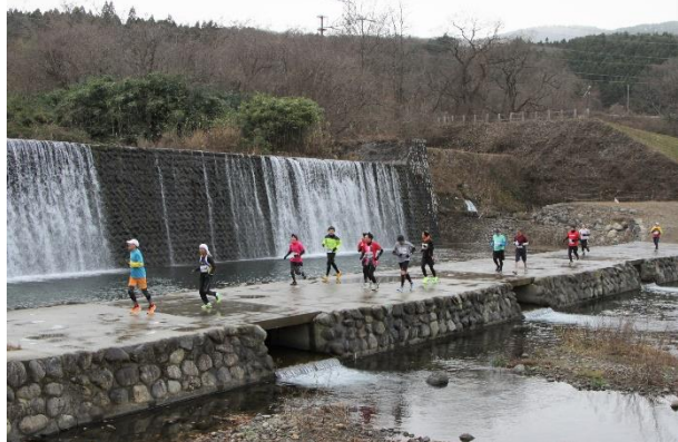
▲地蔵原堰堤を渡るランナーの皆さん

年齢や距離ごとに13の部門に分かれて競技が行われ、自然豊かな荒川の堤防、歴史的土木構造物の地蔵原堰堤、荒川砂防事業の要である荒川遊砂地大暗渠砂防堰堤などをメインとしたコースをランナーたちが汗をかきながら駆け抜けました。