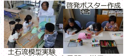
▲6月土砂災害防止月間の様子