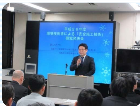
石井事務所長あいさつ