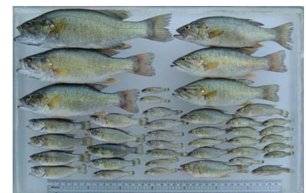
捕獲されたブラックバス類:成魚から稚魚までが出現する

○ 福島河川国道事務所では、これらの調査結果を重く受け止め、平成17年度から「外来魚生息実態調査」を実施しています。 ・その結果、成魚だけでなく、稚魚も多く確認され、阿武隈川の各所に定着し、再生産を行っていることが把握されました。 ・生まれた稚魚は初夏から盛夏期にかけて河川内に広く分散し、流れの強いところまで勢力を拡大します。 ・特に確認個体数が多かった福島市周辺は、天然アユが遡上・摂餌をする範囲とも重複することから、アユ資源や遊漁への影響も懸念されます。