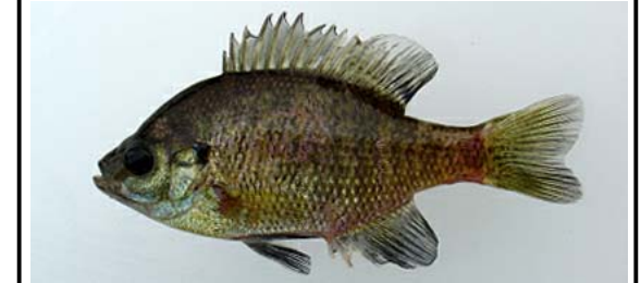
ブルーギル Lepomis macrochirus 湖沼や河川の岸際の流れの緩やかな水草帯を好む。主に全国の湖沼やため池などから報告されている。

●ブラックバス類は、平成2年に伊達崎付近で始めて確認(国勢調査)されて以降、5年間でほぼ全域に出現し、その後も増加を続けています。 ●特に平成11年から16年にかけては、コクチバスが著しい増加傾向を示しており、在来魚への影響が懸念されます。