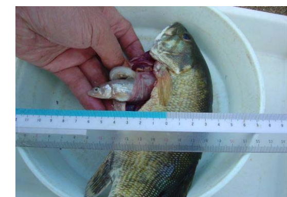
コクチバスの消化管から出てきたアユ