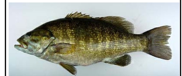
コクチバス Micropterus dolomieu オオクチバスよりも水温の低いところを好み、流れのあるところにも生息する。近年急速に河川への分布を広げており、既に阿賀野川水系、利根川水系でも報告(国勢調査)されている。