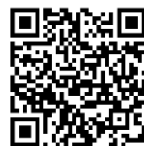
福島河川国道事務所 HP