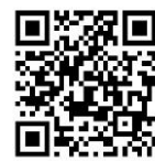
福島河川国道事務所 X