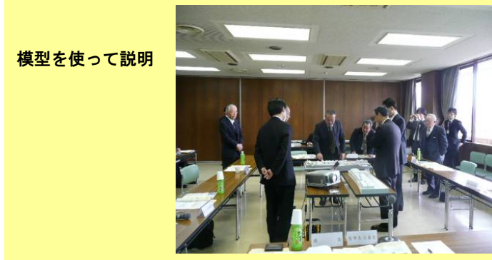
模型を使って説明