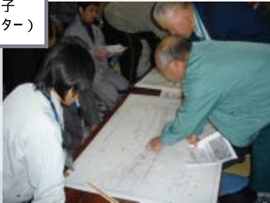
Aゾーン 開催の様子 （北町コミュニティセンター）

「地区毎の意見を聴く会」では、Aゾーン及びC-2ゾーンの築堤に係わる詳細設計図（案）を提示し、設計の内容について説明させていただき、出席された地域の皆様から様々なご意見・ご要望をいただきました。