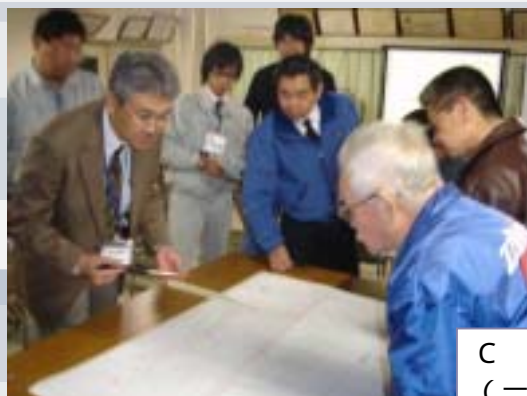
C-2ゾーン 開催の様子 （一区集会所）