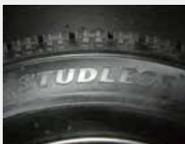
スタッドレス表記の例