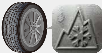
(タイヤの側面に表示されています)