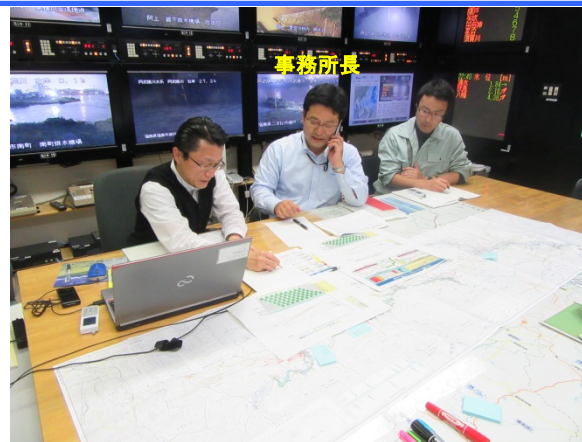
郡山市長へのホットライン状況 阿武隈川の水位状況・見通しを伝達 (H29.10/22 22:51)