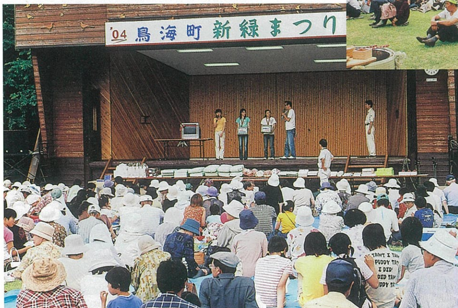
会場には約4000人が訪れました