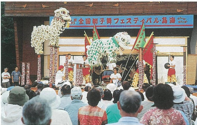
全国各地に伝わる獅子舞の競演