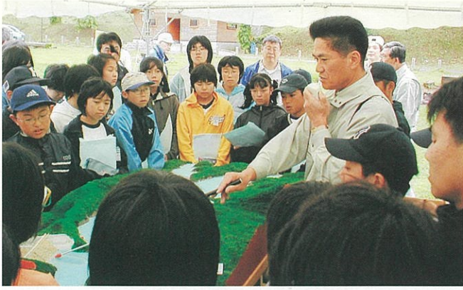
鳥海ダム模型を使った説明