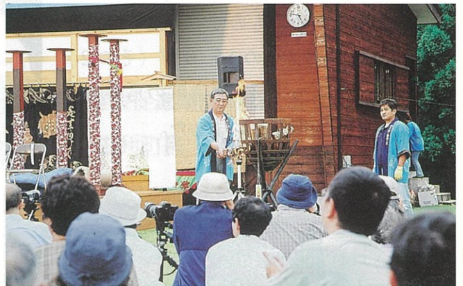
篝火に点火する当所柳町所長