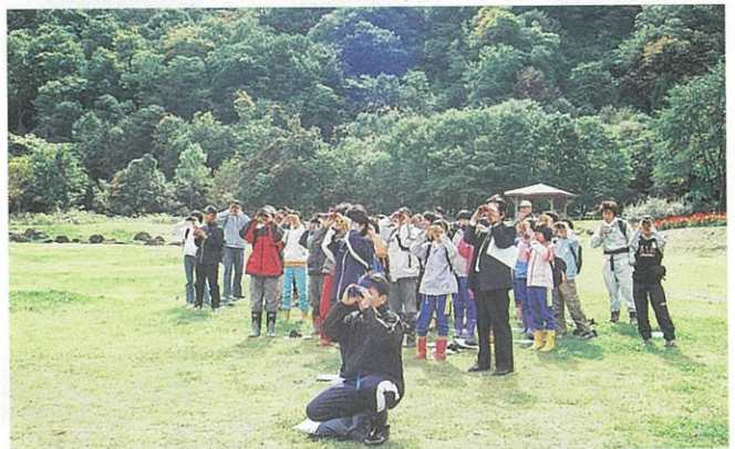
双眼鏡使用の予行練習