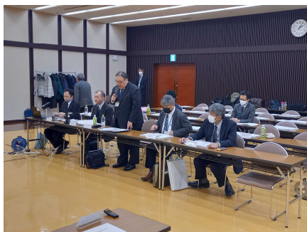
竹内事務所長 挨拶

鳥海ダム工事事務所では、今回の技術的助言を踏まえて、モニタリング調査と環境保全措置を進めていきます。